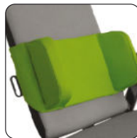
Art.-Nr. 5040005 Bezeichnung Pelottengurt