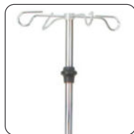
Art.-Nr. 6040202 Bezeichnung Infusionsstativ