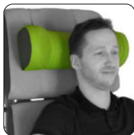
Art.-Nr. 8040300 Bezeichnung Nackenkissen