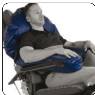
Art.-Nr. 6040119 Bezeichnung Stabilisierungskissen