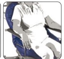
Art.-Nr. 8040701 Bezeichnung Lagerungsrolle