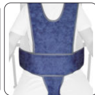
Art.-Nr. 6040110 Bezeichnung Thoraxgurt