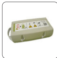
Art.-Nr. 6050001 Bezeichnung Zusatzakku