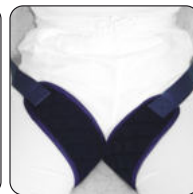
Art.-Nr. 6040110 Bezeichnung Sitzhose