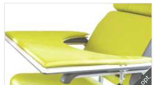
Tisch mit Polsterauflage (optional)