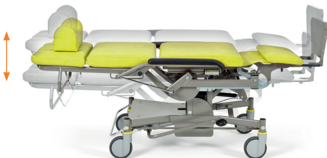
Höhenverstellung in jeder Sitz- und Liegeposition