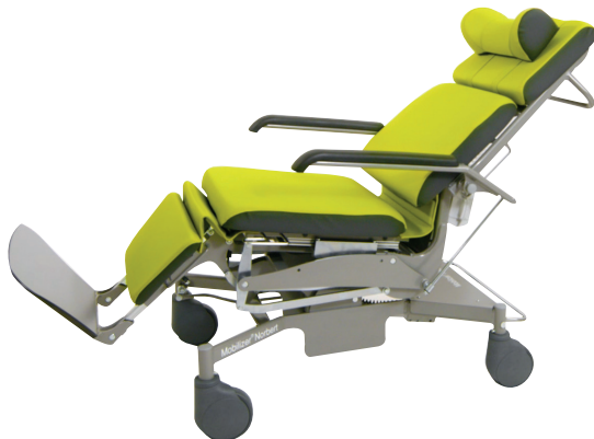
patentiertes Sitzkonzept: Längenausgleich mit automatischer Sitzkantelung bei Verstellung der Rückenlehnenneigung