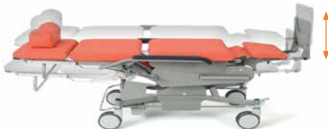
stufenlos elektromotorisch verstellbar