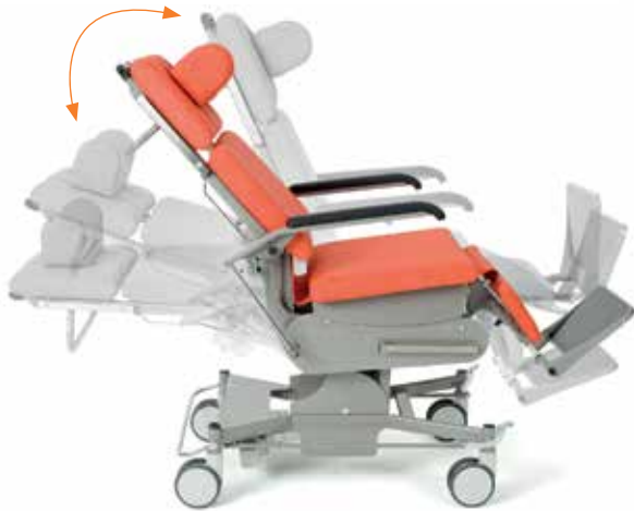
Höhenverstellung in jeder Sitz- und Liegeposition